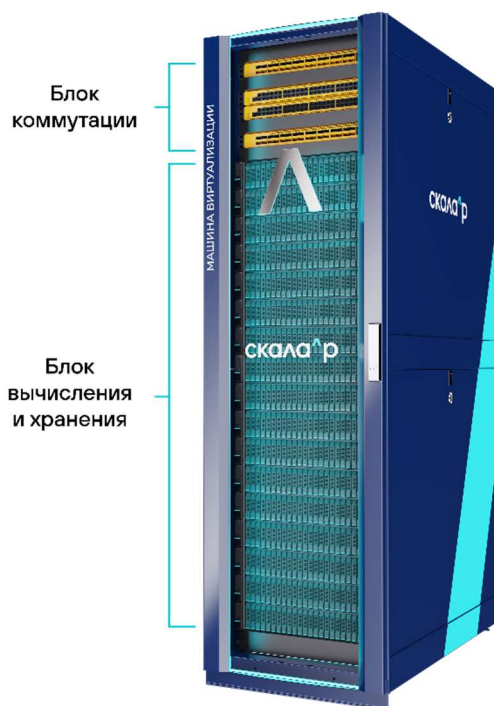
Рисунок 2. Состав Машины виртуализации

Машина виртуализации состоит из следующих блоков: