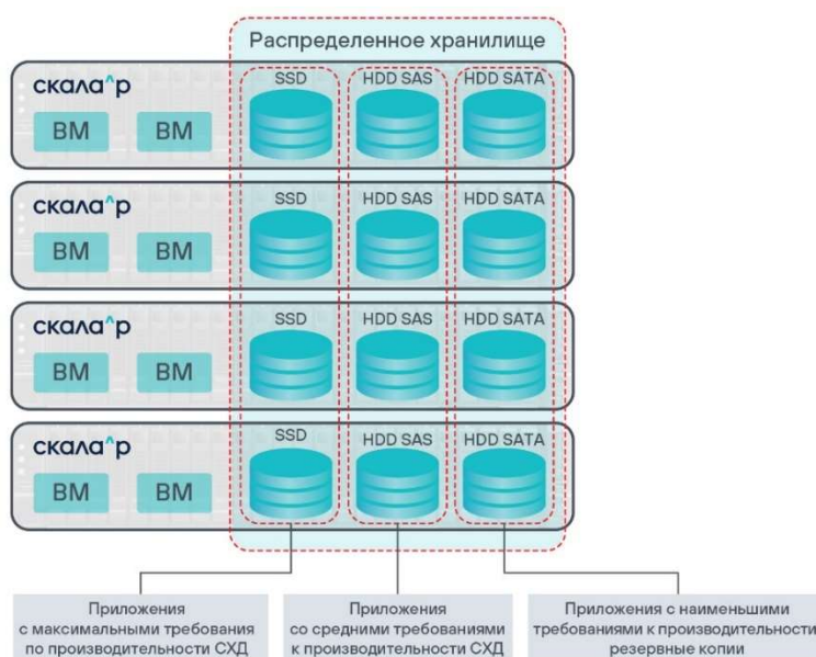
Рисунок 1. Типовая схема комплекса Скала^р МВ.С

Типовая схема комплекса Скала^р МВ.С подходит для решения большинства стандартных задач, связанных с обеспечением работы информационных систем.